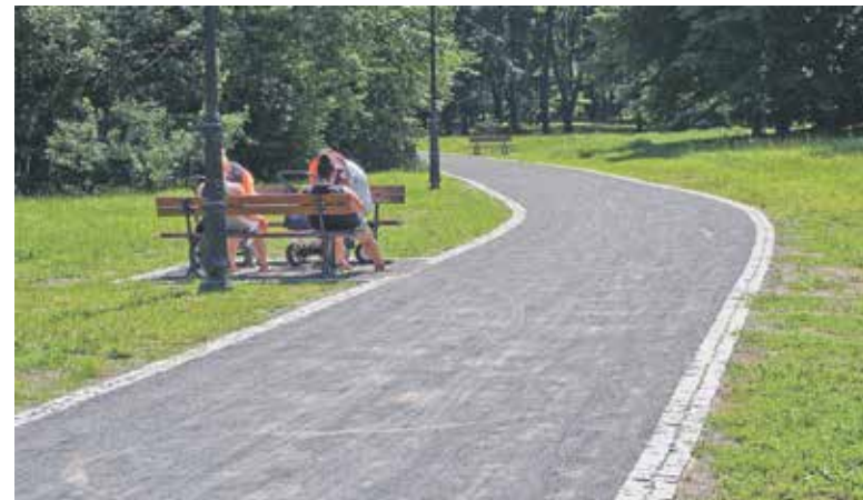
Zabytkowy Park w Sławięcicach jest już po liftingu