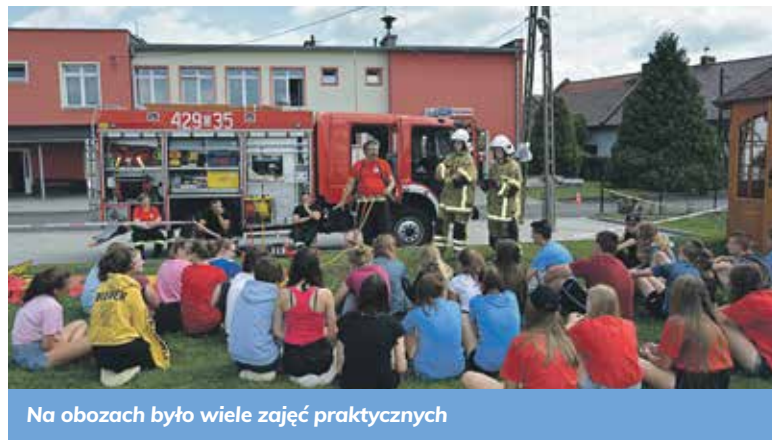
Na obozach było wiele zajęć praktycznych