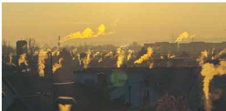
Wymiana starych, nieekologicznych pieców pozwoli na zmniejszenie emisji zanieczyszczeń wokół nas

Chodzi przede wszystkim o przyłączenie gospodarstw indywidualnych do sieci ciepłowniczej bądź gazowniczej lub wymianę przestarzałych pieców na nowe. Marszałek Andrzej Buła podkreśla, że ten pilotaż wprowadzany jest po szerokich konsultacjach w całym regionie. – Mamy na ten cel w Regionalnym Programie Operacyjnym trzy miliony euro, ale zakładamy, że montaż finansowy takich projektów będzie się składać z trzech równych części – informuje. Pierwszą stanowić będą pieniądze unijne z urzędu marszałkowskiego, drugą – pieniądze gminy, trzecią – wkład mieszkańców, czyli właścicieli gospodarstwa, którzy zechcą stare piece wymienić. – To oznacza, że nasze trzy miliony euro wygenerują inwestycje o wartości 9 mln euro – podkreśla marszałek.