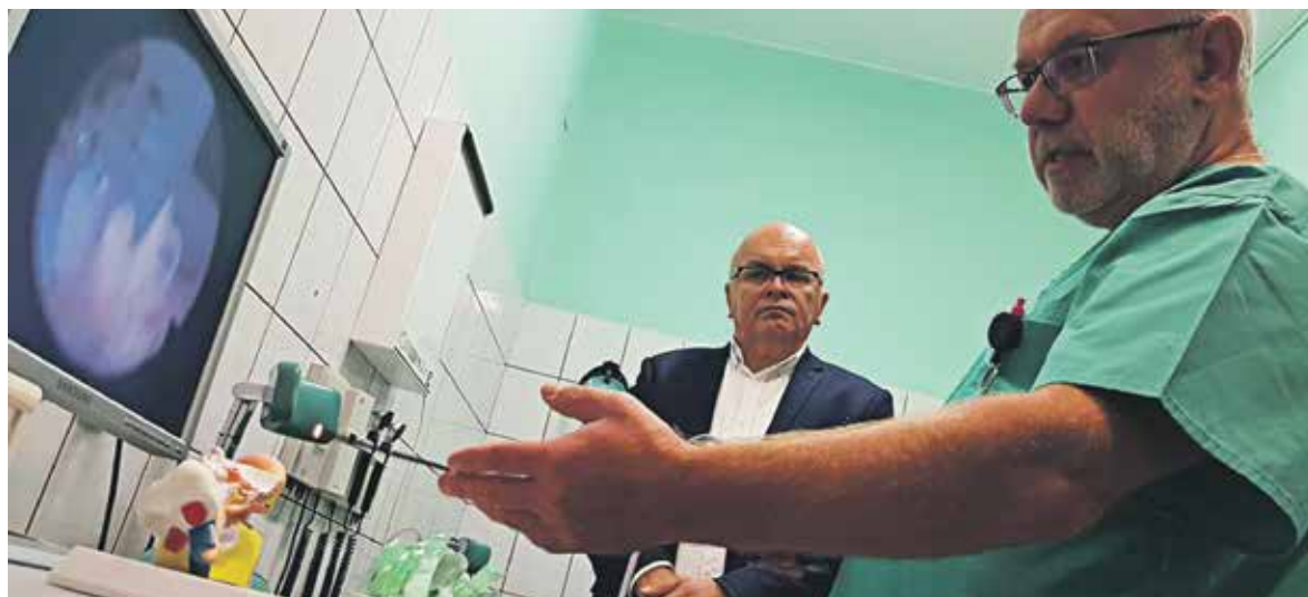
Lekarze na oddziale neonatologii cieszą się z nowego sprzętu

Kolejny sprzęt trafił do szpitala w Kędzierzynie-Koźlu. Najnowsze kardiomonytory pracują już na oddziale neonatologii, dwa wysokiej klasy urządzenia przyjechały też na oddział laryngologii. To nie jedyne pieniądze dla szpitala.