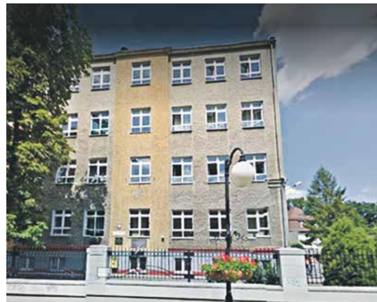
Prace w kędzierzyńsko-kozielskiej PSP nr 12 zostały już zakończone

– To inwestycje przemyślane. W 14 z 16 obiektów będą zainstalowane odnawialne źródła energii, wpływamy w ten sposób na zmniejszenie smogu. Jako samorządowcy dajemy dobry przykład mieszkańcom. Na przykładzie tych inwestycji mogą się uczyć, w jakim kierunku iść, jak remontować, dbając jednocześnie o jakość powietrza. To mają być takie wzorcowe inwestycje – mówi marszałek Andrzej Buła . Prezydent Kędzierzyna-Koźla Sabina Nowosielska dodaje, że wszyscy partnerzy projektu