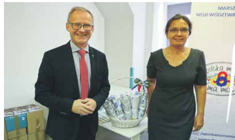
Kędzierzyński szpital, jak wszystkie w regionie, otrzymał kocyki dla noworodków. To akcja promująca programy profilaktyczne dla najmłodszych i ich mam