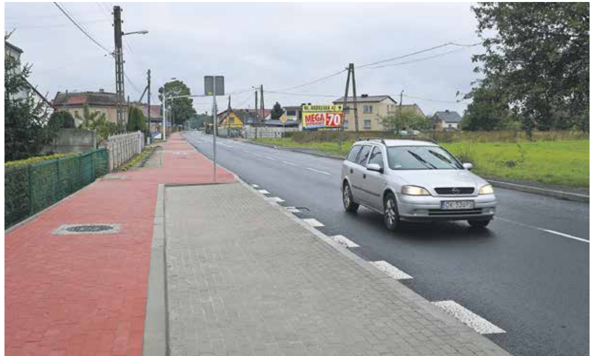
Teraz w Starym Koźlu są dobrze oznakowane chodniki i bezpieczne zatoczki dla autobusów