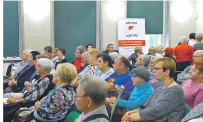
Spotkanie w Kędzierzynie Koźlu połączone z inauguracją zajęć Uniwersytetu III Wieku

Podczas spotkań urząd marszałkowski promuje program „zdrowa wątroba”, wdrażany już tej jesieni, a polegający na przebadaniu w kierunku obecności wirusa zapalenia wątroby typu c wszystkich hospitalizowanych