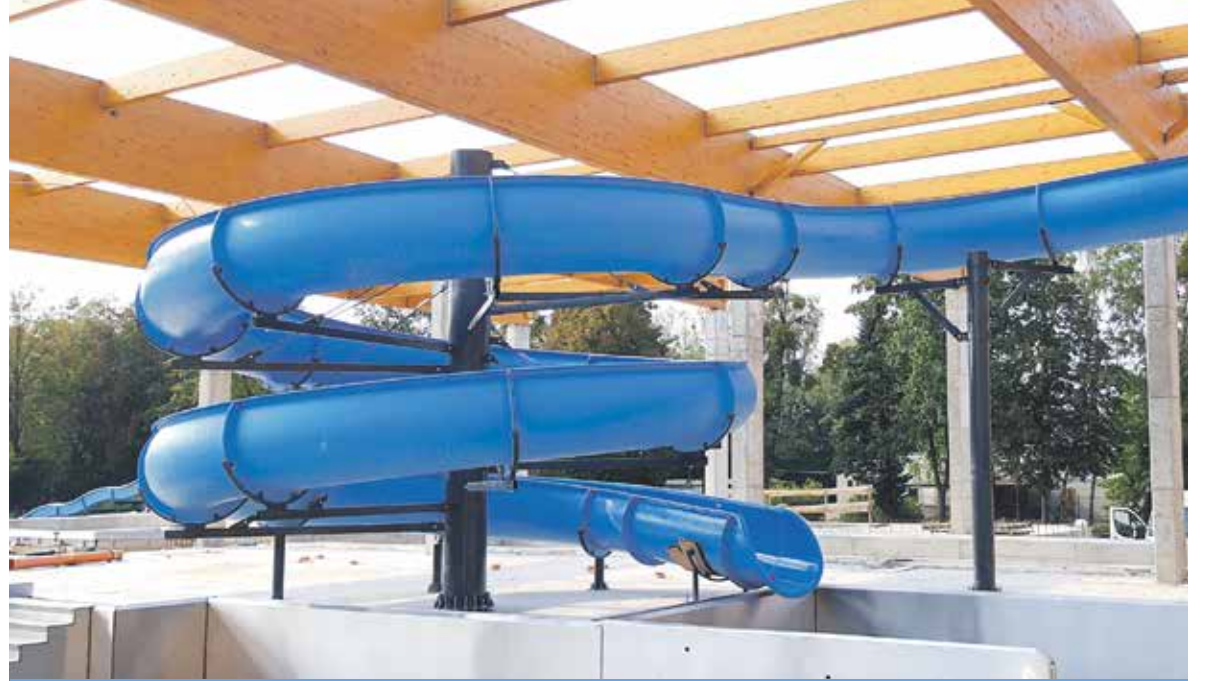
Basenowa zjeżdżalnia jest już zamontowana