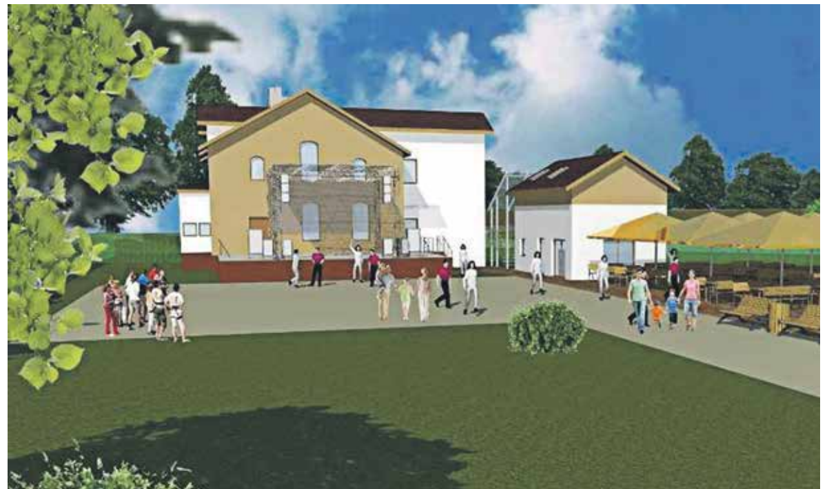
Tak będzie wyglądać kędzierzyńsko-kozielska przystań po remoncie