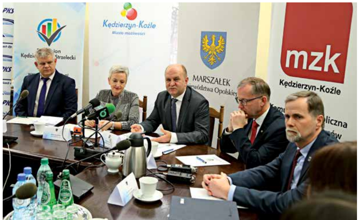
Umowa na ten duży projekt została podpisana w lutym tego roku