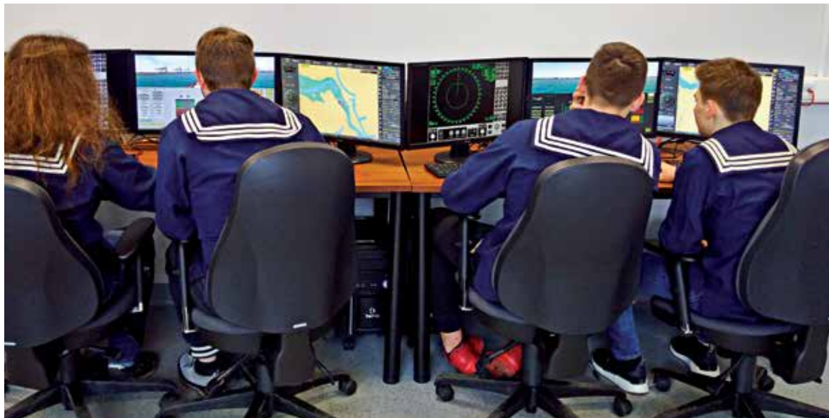
Symulator mostka nawigacyjnego w Zespole Szkół Żeglugi Śródlądowej pozwala uczniom na ćwiczenia sytuacji, które mogą się wydarzyć w rzeczywistości

Dzięki projektowi „Wsparcie kształcenia zawodowego w klu-