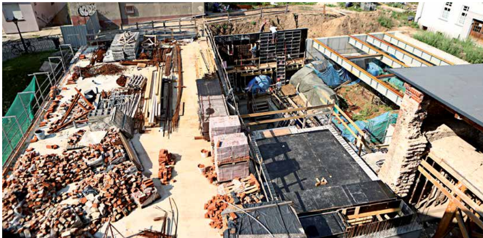
Prace przy renowacji i budowie idą pełną parą

Trwają zaawansowane prace budowlane przy renowacji zabytkowego kompleksu zamkowego. Umowa z urzędem marszałkowskim na to zadanie została podpisana w sierpniu 2017 roku.