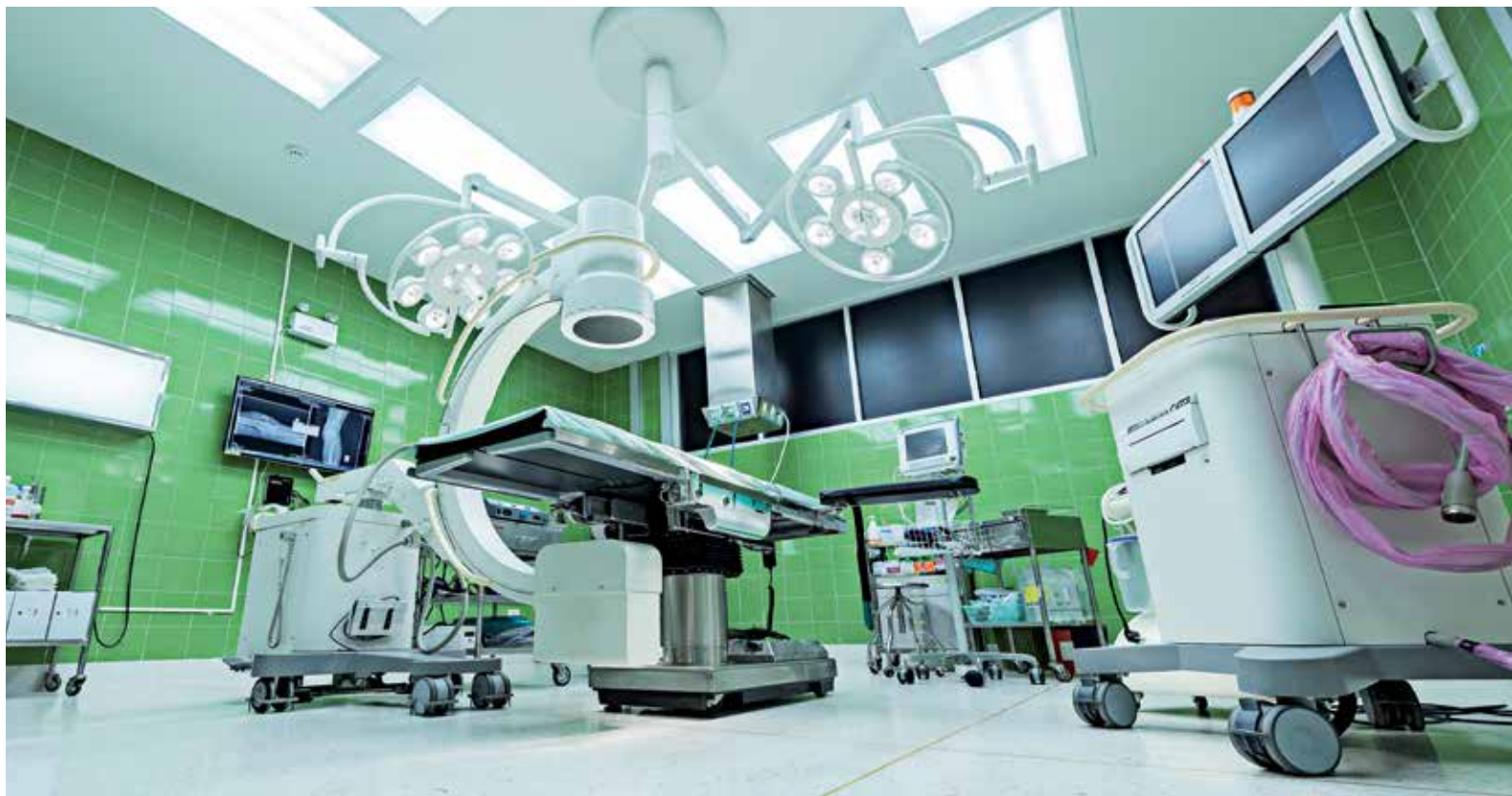
Kędzierzyńsko-kozielski szpital wzbogaci się m. in. o nowoczesny blok operacyjny

- Urząd marszałkowski ma unijne pieniądze nie tylko na szpitale wojewódzkie, ale również powiatowe. Jak są one dzielone?