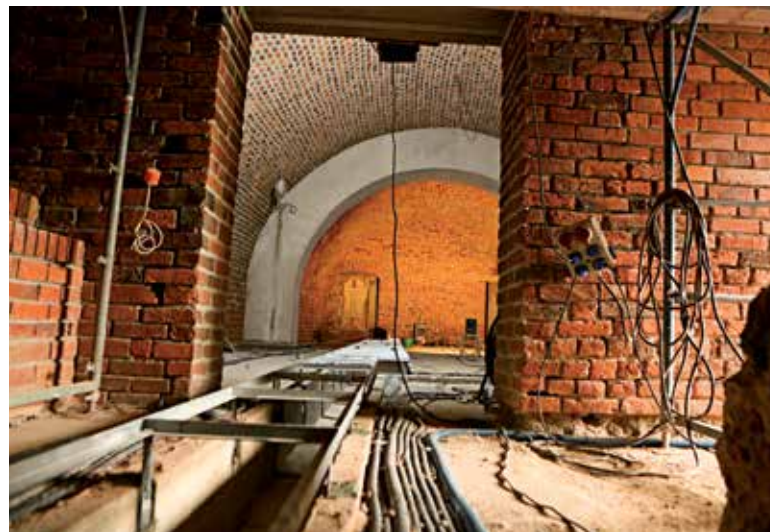
Piwnice adaptowane są na cele muzealne

kościowa w stosunku do tego, co było wcześniej – przyznaje z zadowoleniem Bolesław Bezeg. Projekt – jak wyjaśnia – obejmuje skrzydło południowe zamku, czyli piwnice i dziedzińiec z reliktem najstarszej budowli świeckiej w województwie opolskim. Dziedzińiec powstający nad reliktem był kiedyś ziemnym klepiskiem. Po wylaniu betonowej konstrukcji sklepienia zostanie odtworzony z zastosowaniem łamanych kamieni polnych. W tej chwili wykonawca zwiózł już materiał – kamienie, które zostaną wyselekcjonowane i wykorzystane na dziedzińcu. Projekt nie obejmuje natomiast lamusa stanowiącego wschodnie skrzydło