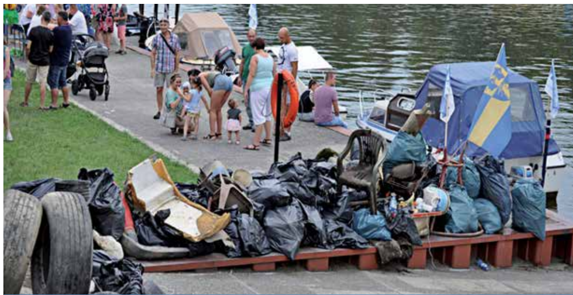
W sprzątkaniu Odry i Kłodnicy wzięło udział niemal 200 osób.

Projekt likwidacji dzikich wysypisk wzdłuż brzegów Odry i Kłodnicy to jedyny projekt ekologiczny, realizowany w ramach pierwszej edycji Marszałkowskiego Budżetu Obywatelskiego. W czyszczeniu rzeki wzięło udział blisko 200 osób.