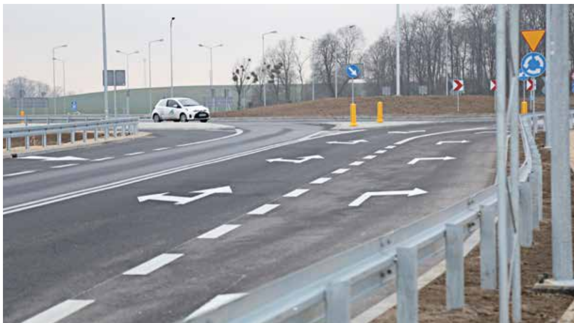
Rondo przy węźle autostradowym Kędzierzyn-Koźle znacząco ułatwiło dojazd do autostrady A4

Województwo opolskie gruntownie zmodernizowało drogę wojewódzką nr 426 łączącą Kędzierzyn-Koźle ze Strzelcami Opolskimi, jak i węzłem autostrady A4 Kędzierzyn-Koźle (dawniej Olszowa). Głównym zadaniem tej modernizacji było bezpieczne połączenie strategicznych traktów komunikacyjnych – ważnej dla województwa