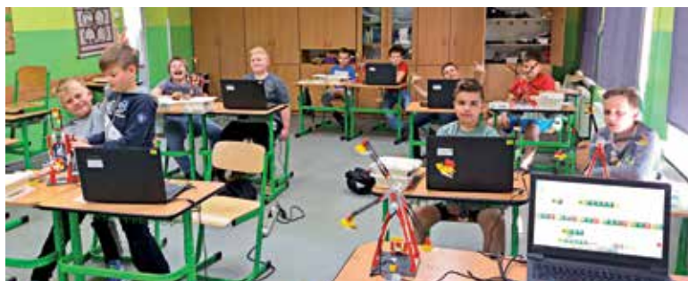
W ramach „Szkoły eksperymentów i doświadczeń” bardzo ciekawe był zajęcia z robotyki

Budowa boiska w Starej Kuźni w gminie Bierawa powinna zakończyć się z końcem listopada tego roku. Wójt Krzysztof Ficoń systematycznie od kilku lat remontuje obiekty sportowe, unowocześnia boiska i sale gimnastyczne. Część z tych inwestycji została doposażona z funduszy unijnych. Dzięki ciekawym pomysłom gminy z nowego sprzętu korzystają m.in. uczniowie szkół w Solarni, Bierawie, Starym Koźlu,