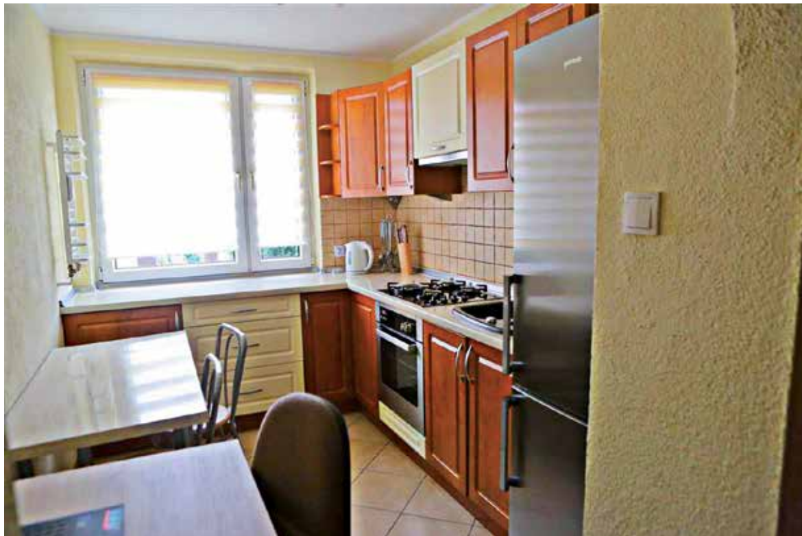
W pełni wyposażona kuchnia...

– Projekt realizowany przez Regionalny Ośrodek Polityki Społecznej wpisuje się w nasze wcześniejsze programy. To