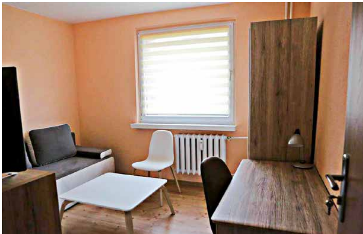
... i pokój

Agnieszka Gabruk, zastępca dyrektora Regionalnego Ośrodka Polityki Społecznej w Opolu zwraca uwagę na finansowe