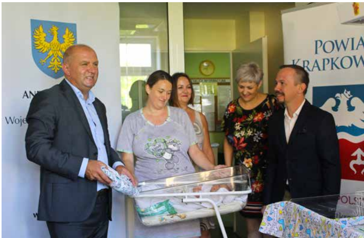
Kocyki dla wszystkich noworodków z województwa opolskiego – to pomysł urzędu marszałkowskiego, promujący program bezpłatnych badań i porad dla najmłodszych i ich matek. Kocyki trafiły do wszystkich szpitali w regionie, m.in. do Krapkowic

Za 2,5 mln zł unijnego dofinansowania krapkowicki szpital wzbogacił się m.in. o wideogastroskop i kolonoskop z procesorem HD, wideokolonoskopy i gastroskopy zabiegowe, aparaty do znieczuleń, stół operacyjny, skanery żył, aparaty USG,