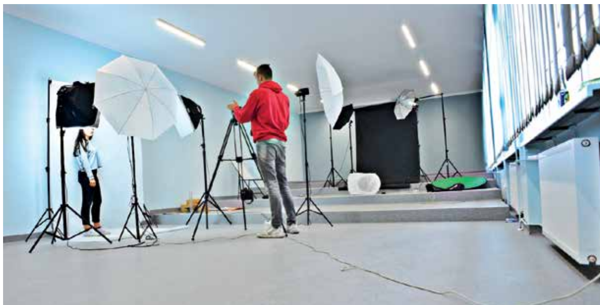
W szkole jest też profesjonalny sprzęt fotograficzny.

laboratoryjny, komputerowy, dydaktyczny. - Zależało nam nie tylko na nowoczesnym sprzęcie, ale również możliwości utworzenia ośrodka egzaminacyj-