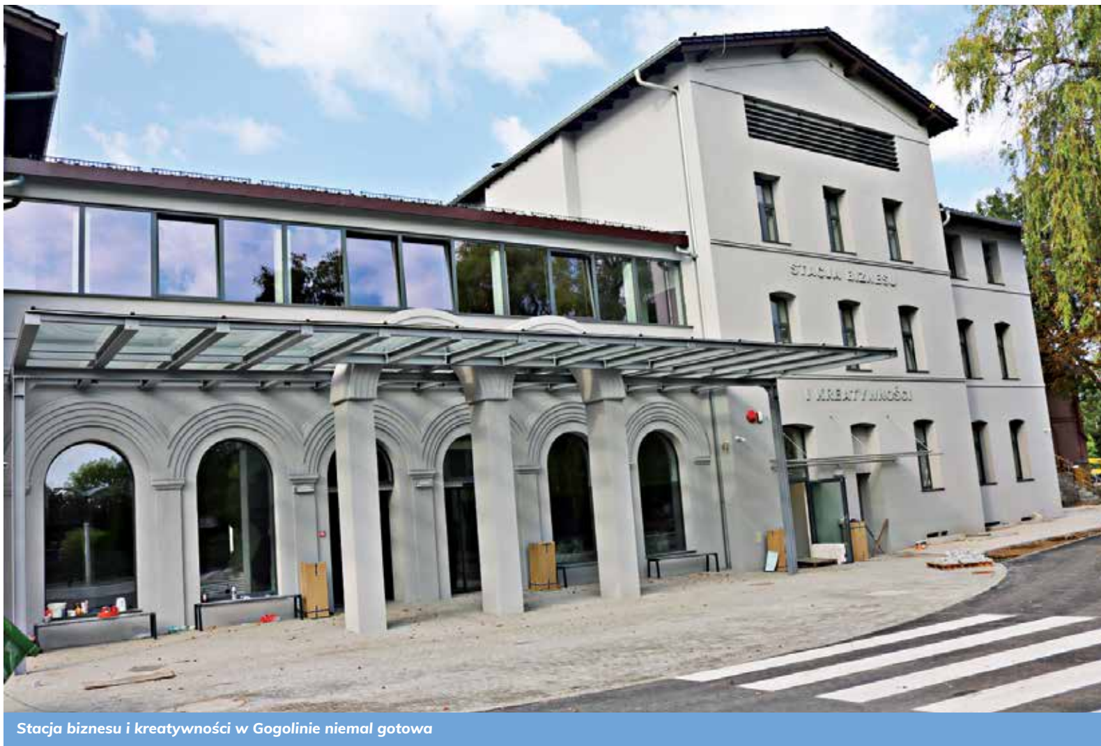
Stacja biznesu i kreatywności w Gogolinie niemal gotowa

Obok znajduje się plac, z którego będą odjeżdżały autobusy. – W ramach aglomeracji opol-