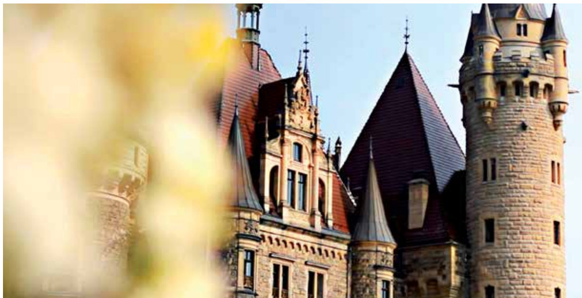
Zamek w Mosznej to jeden ze sztandarowych produktów turystycznych województwa

Prace związane z remontem zostały podzielone na pięć etapów. Najważniejszym elementem była renowacja okien.