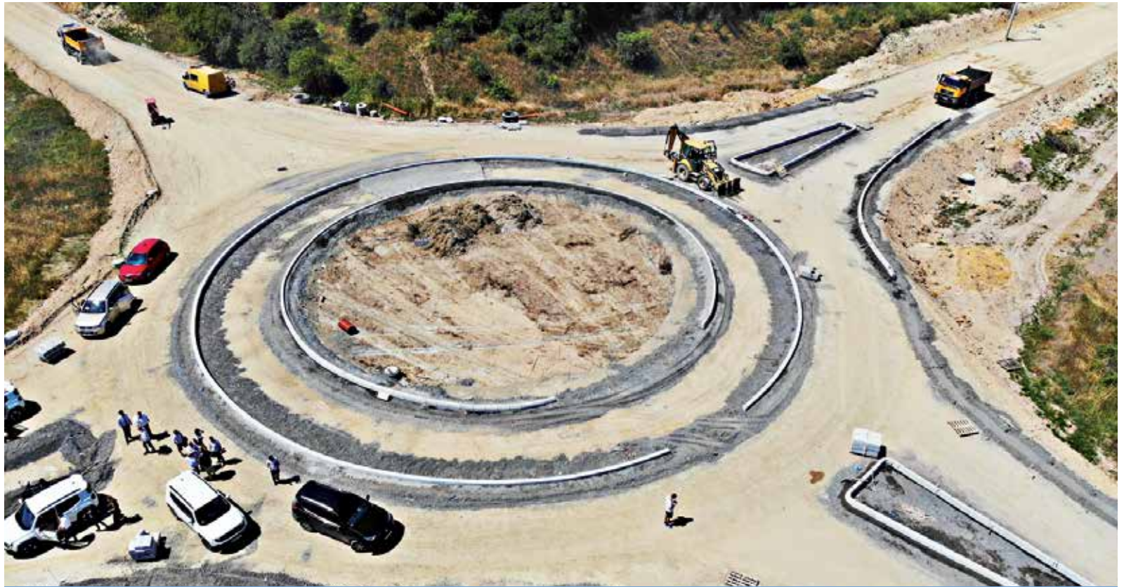
Na budowie widać już nowe rondo i ślad nowej, dawno wyczekiwanej drogi

g-Bud, wykonawca inwestycji, przyznaje, że jego firma ma doświadczenie związane z budową dróg betonowych. – Podobną drogę budowaliśmy w Dąbrowie Górniczej. Pod względem wytrzymałości jest to bardzo dobra decyzja. Wylewać beton możemy w każdych warunkach. Utrudnienia mogą wystąpić zimą, gdy spadnie śnieg, czy będą ulewne deszcze – mówi Tomasz Kędzior. Obwodnica będzie poprowadzona nowym śladem drogi wojewódzkiej nr 423 będącym połączeniem Opola z węzłem autostradowym „Gogolin”. Obwodnica połączy się z drogą wojewódzką nr 423.