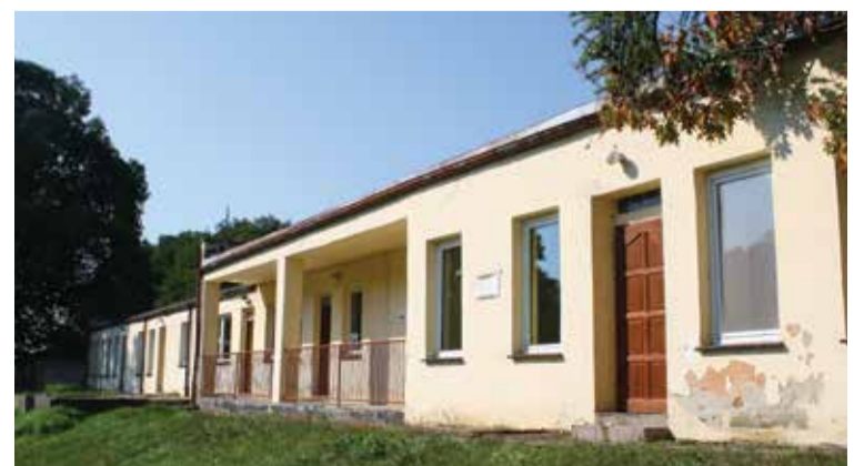
Tak budynek przy basenie wygląda jeszcze dziś