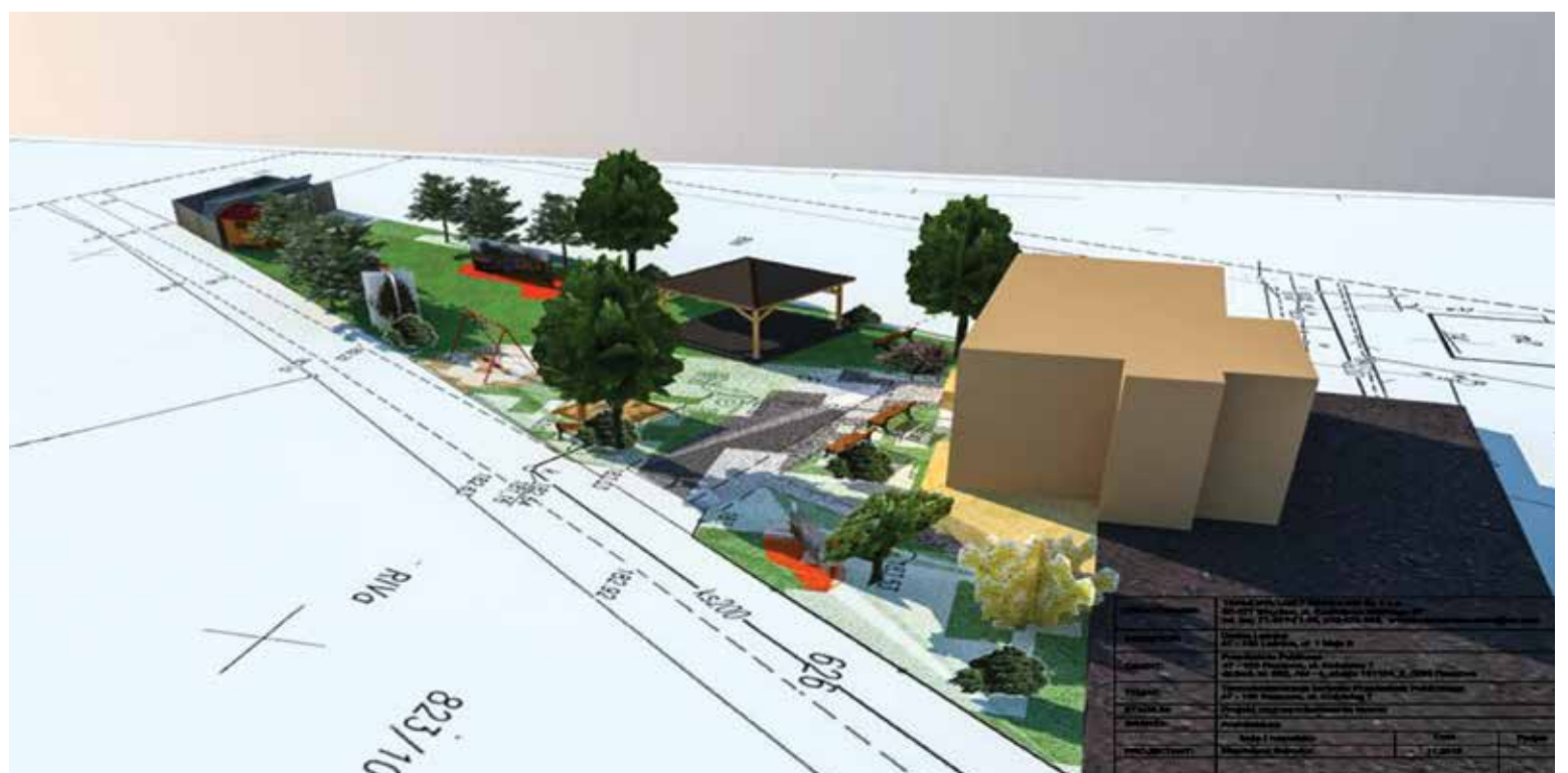
Tak będzie wyglądać przedszkole i plac zabaw w Raszowej.