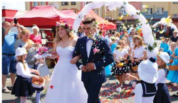
Targi panieńskie w Ujeździe już na stałe weszły do promocyjnego kalendarza regionu