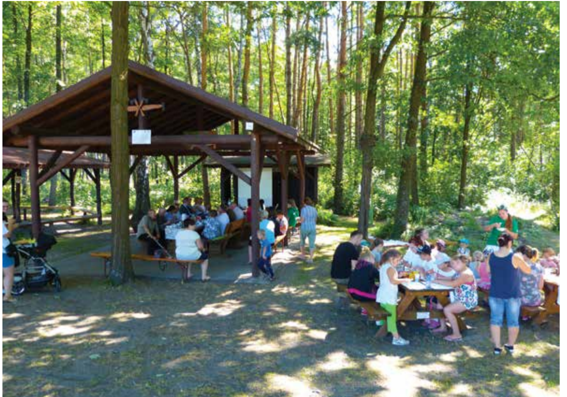
Eko-przystanek w Spóroku

Zrealizowane prace przy zagospodarowaniu terenów wokół stawu, w bardzo dużym stopniu zintegrowały mieszkańców wsi, a zaangażowanie wszyst-