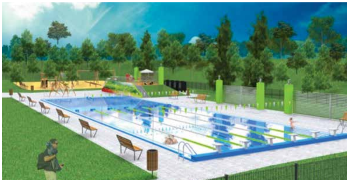
Tak basen będzie wyglądał w przyszłości

Projekt o wartości blisko 5,8 mln zł uzyskał unijne dofinansowanie z Regionalnego Programu Operacyjnego Województwa Opolskiego 2014-2020 w kwocie ponad 2,7 mln zł. Inwestycja obejmuje przebudowę basenu, modernizację terenów wokół basenu o elementy małej infrastruktury oraz budynku przylegającego. Powstaną niewielkie salki szkoleniowe oraz pomieszczenia do spotkań indywidualnych. W zmodernizowanym budynku planuje się utworzenie pomieszczenia kaso-wego, przebieralni, zaplecza dla obsługi, przestrzeni małej gastronomii oraz bazy WOPR. Pojawi się nowa instalacja sanitarna i elektryczna. Jednym z elementów projektu jest także wykonanie stacji uzdatniania wody wraz z infrastrukturą techniczną. Obiekt będzie