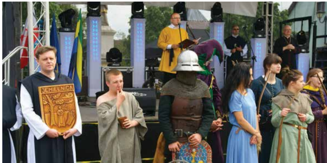
Pieniądze otrzymane w ramach Leadera pomogły w organizacji Jarmarku Cysterskiego w Jemielnicy

Ponad 10 mln złotych na okres 2014-2020 ma do wydania LGD Kraina Św. Anny. Do dofinansowania wybrano tu 38 projektów (z 91 zgłoszonych). W ramach podejmowania działalności gospodarczej powstanie m.in. gabinet logopedyczny, stomatologiczny a także innowacyjna firma budowlana. W ramach rozwoju już istniejącej działalności gospodarczej utworzone zostanie mobilne muzeum Kanału Gliwickiego wraz z infrastrukturą rekreacyjną, skatepark oraz