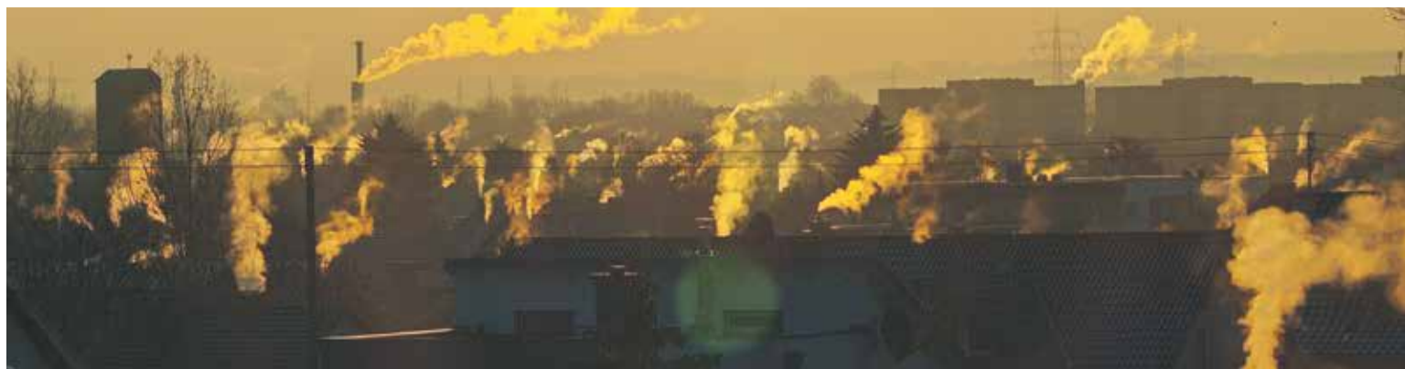
Wymiana starych, nieekologicznych pieców pozwoli na zmniejszeniu emisji zanieczyszczeń wokół nas

Pieniądze unijne będą przekazywane w formie dotacji, natomiast nie ma w RPO ograniczeń, dotyczących