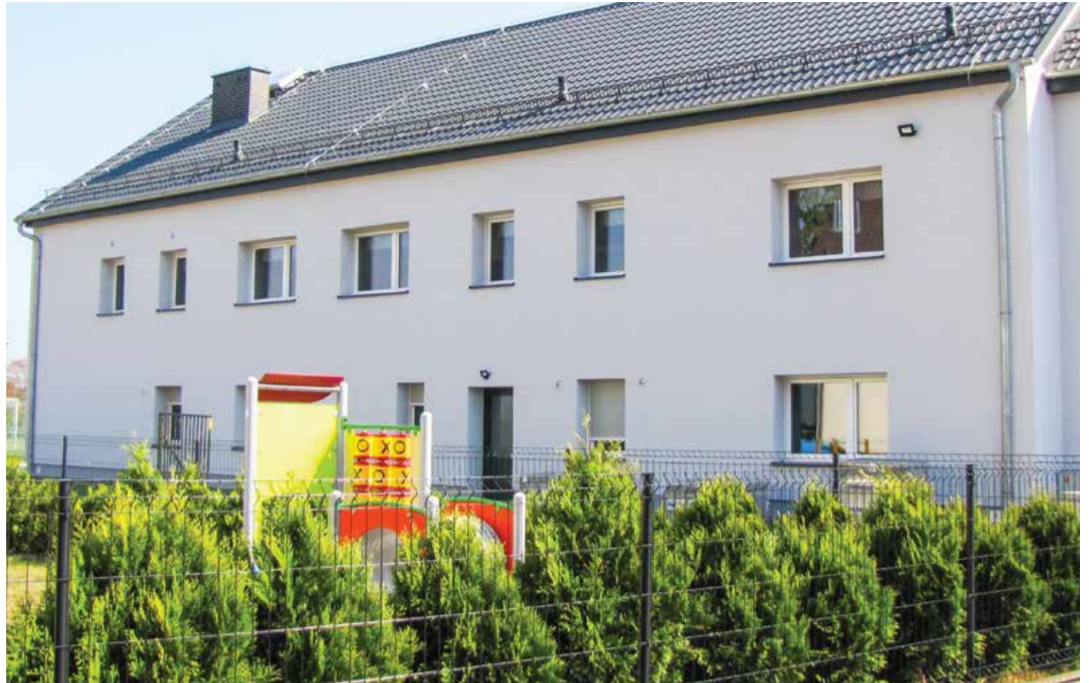
Mieszkańcy Piotrówki dumni są z budynku swojej świetlicy

Wymienione zostaną okna, ocieplone ściany oraz dach, wykonana elewacja. Obiekt stanie