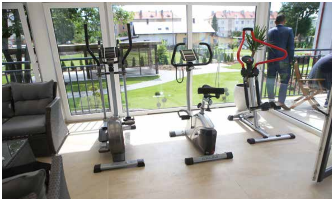
W DS Tiliam można też dbać o kondycję fizyczną

W połowie ubiegłego roku firma NADIR otworzyła w Zawadzkiem Dom Seniora „Tiliam”. Są tu jednoosobowe pokoje z łazienkami, w a w ofercie rehabilitacja, opieka internisty i geriatry, bogata oferta zajęć plastycznych, informatycznych, wyjazdy na wycieczki krajoznawcze.