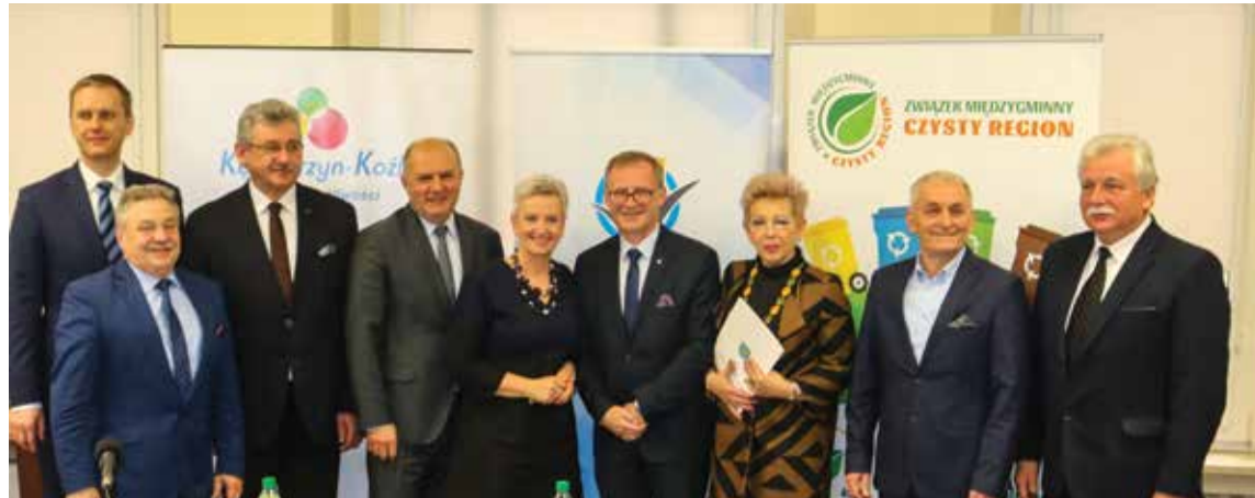
Umowa na unijne dofinansowanie pierwszych PSZOK-ów została podpisana przez wszystkie zainteresowane samorządy

W Zdieszowicach PSZOK zostanie zbudowany od podstaw, znana jest już jego lokalizacja. – Na początku planowaliśmy, że będzie się on znajdował przy obecnym punkcie odbiorów odpadów